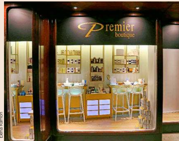
El nuevo centro de Premier Skin Care, en Diagonal, 472-474.

quiler. La nueva tienda emplea a unos siete trabajadores, y ofrecerá toda la línea de productos de Premier, un total de 150 que van desde higiene personal hasta cosmética o perfumería, todos elaborados a partir de materiales extraídos del Mar Muerto. Premier Skin Care, fundada en 2007 y con sede en Barcelona, es la filial española y portuguesa de la israelí Dead Sea Premier Cosmetics, una empresa con presencia en más de 60 países y más de 25 años de experiencia en el sector de la cosmética, la higiene y el cuidado personal de alta gama.