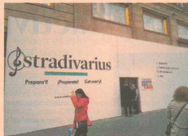
La tienda del Passeig de Gràcia está casi lista para su reapertura.

2010, cuando sustituyó a la firma de ropa deportiva alemana Puma. Hoy, en este tramo del paseo la competencia ha aumentado. En el último año han abierto H&M, Uniqlo y Kiabi. Por su parte, Stradivarius ha sido una de las firmas más activas del grupo gallego Inditex: por un lado, con el lanzamiento de la mencionada colección para hombres y, por otro, por superar el número de las mil tiendas gracias a su expansión internacional, al que sólo habían llegado Zara y Bershka.