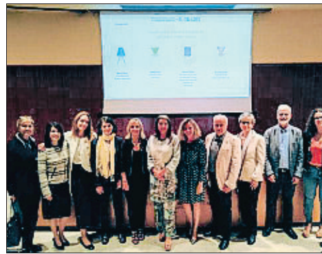
Grup per a l'equitat de gènere del CCJC