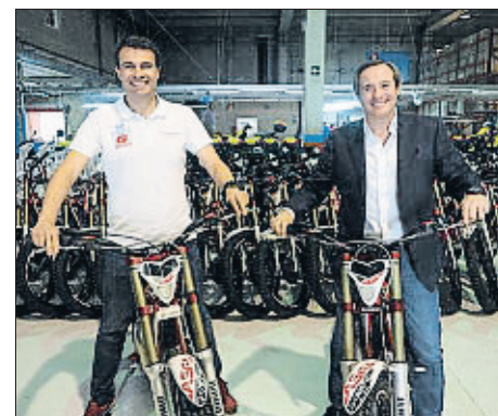
PERE DURAN / NORD MEDIA

BTC va entrar en el capital de Torrot el 2015 quan aquesta firma necessitava capital per comprar la unitat productiva de Gas Gas, en concurs de creditors. Des d'aleshores, el fabricant no ha parat de créixer. El 2017 va fabricar 16.000 motos i va factu-